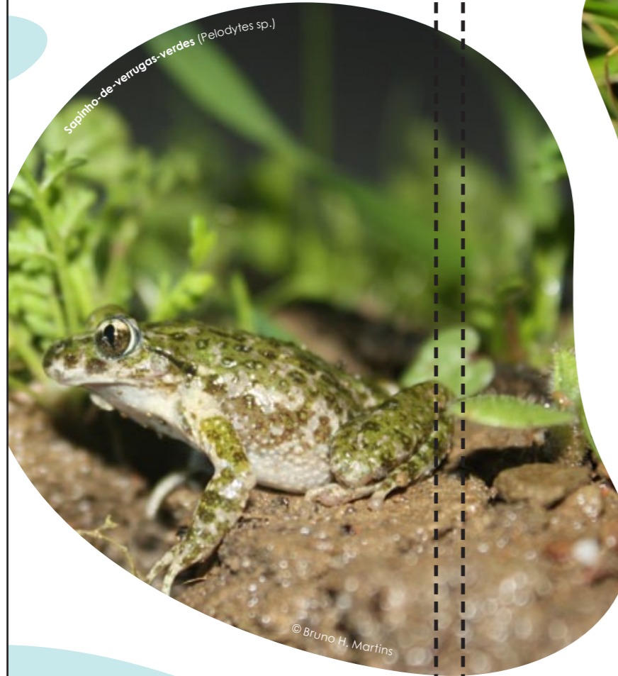
Sapinho-de-venozos-verdes (Pelodytes sp.)