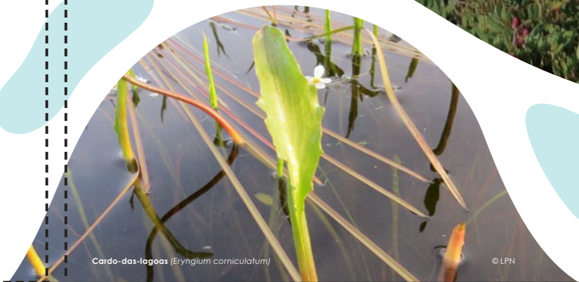
Cardo-das-lagoas (Eryngium corniculatum)