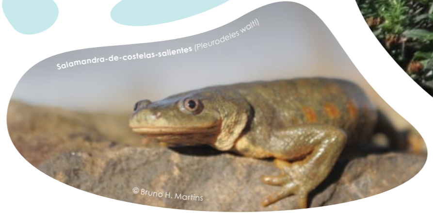
Salamandra-de-castelas-salientes (Pleurodeles waltl)