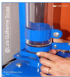
4. Limpeza de sementes com soprador