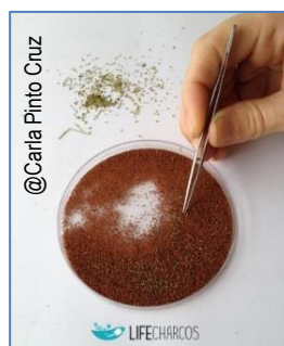
5. Limpeza manual de sementes