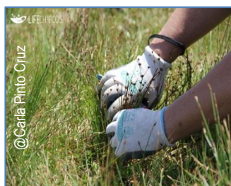
1. Recolha de sementes