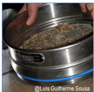
3. Limpeza de sementes com peneiros