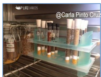
8. Banco de germoplasma

O elenco florístico dos Charcos Temporários é o que caracteriza este habitat sendo a sua diversidade elevada, pouco abundante e por vezes rara. É por isso que este habitat é tão especial e é-lhe conferido proteção legal devido às várias espécies com estatutos de conservação. Existe um enorme património genético nos Charcos Temporários da Costa Sudoeste de Portugal com um valor intrínseco incalculável e o Projeto LIFE Charcos pretende conserva-lo a médio e longo prazo.