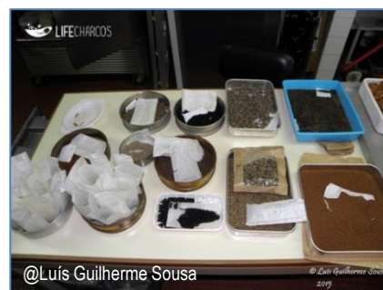
6. Secagem das sementes