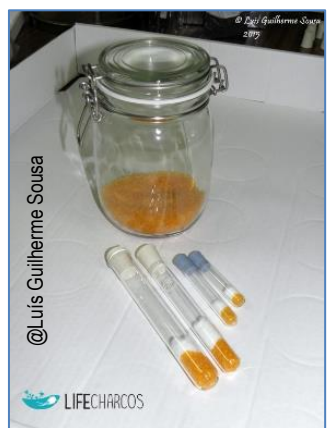
7. Armazenamento de sementes