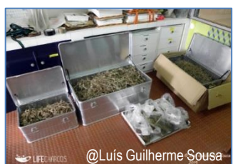
2. Sementes no laboratório para processar